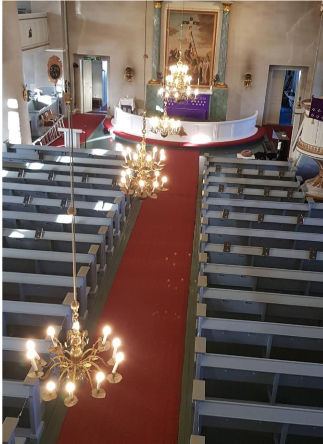
Sisäkuva kirkosta, jossa näkyvät kynttiläkruunut

Kirkon keskikäytävän kruunuvalaisimet vaativat huoltoa ja saneerausta nykyaikaan. Kruunuja on 4 kpl: 1 kpl 30 -haarainen, 1 kpl 16 -haarainen ja 2 kpl 10-haaraista. Lisäksi on saarnatuolissa 3 -haarainen lukuvalaisin. Kirkon peruskorjauksen yhteydessä on tarkoitus kunnostaa nämä valaisimet. Kruunuja myös nostetaan ylemmäksi.